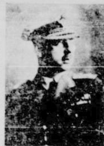
M. S. Regele CAROL II

Tot așa nimenia altul nu dovedește astăzi o mai sta-