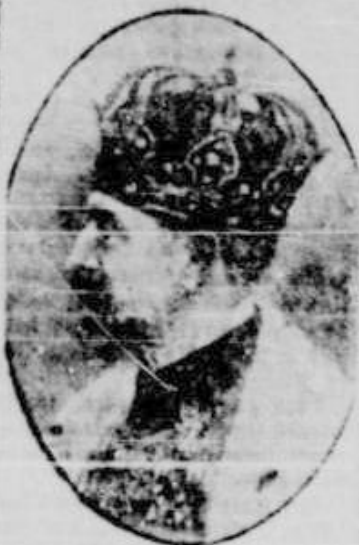
Regele FERDINAND I

Și faptul atât de firesc pentru un Suveran activ și vigilent, are și o părțică de latură umană, dela care, is- rași firește, nu se poate sus- ține personificarea sentimen- tali malul intens, curat și su- perior, care este actualul Rege al României: La Hârșova, în vara anului 1903, în excu- rsiune fiind împreună cu Au- guștii Săi predecesori, Carol II, Principele adolescent pe a- luncă, primea, în dar, din mâinile unui bătrân dobro- gean o sabie, cu următoarea