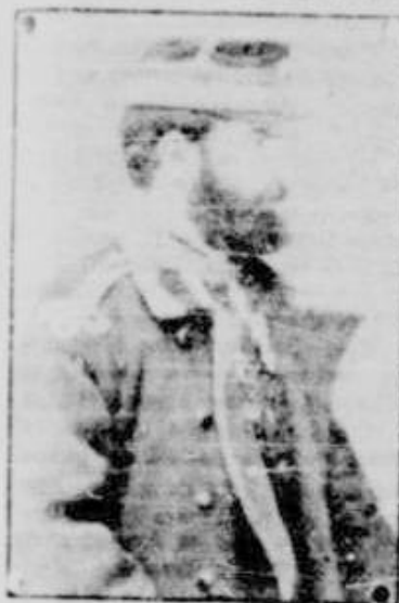
Regele CAROL I

Întâlnindu-mă, deunăzi, în- âmplător, cu prietenul din copărie, avocatul St. Ci- mighiu, Cernavodean din naș- tere stabilit azi în Capitala și apucându-ne să deprimăm pe îndelete evenimentele zi- lei — fața fiind și feciorul său, un flăcău de toată frumuse- țea — la un moment dat, sim- țulat de o alarmă: a mea, făcută pe un ton cate- goric și foarte, amicul meu a exclamat cu aceeași nestră- mutată convingere: