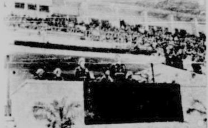
Dorind să creeze o nație nouă, vigoasă, născută constructivă, M. S. Regele a creat Străjeria. Iată-L împreună cu Măria Sa Voievodul Mihai, primindu-și tineretul străjoresc.